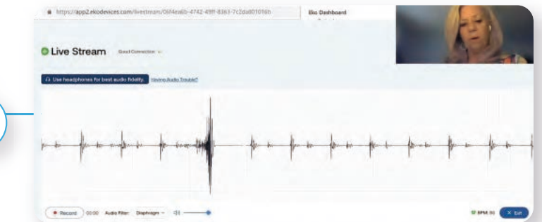
リモートの専門医