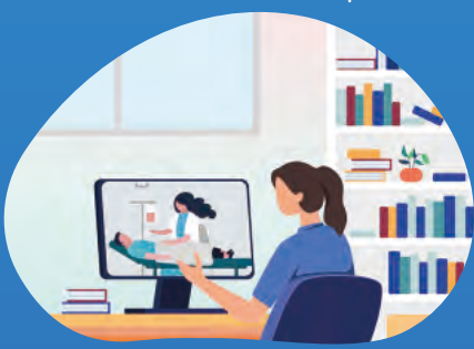
遠隔地にいるベテラン看護師

D to D / D to N Doctor to Doctor / Doctor to Nurse 病院の医療スタッフとリモートの専門医が連携し、より高度な治療を行う 医師不足の医療現場に遠隔地の医師が支援